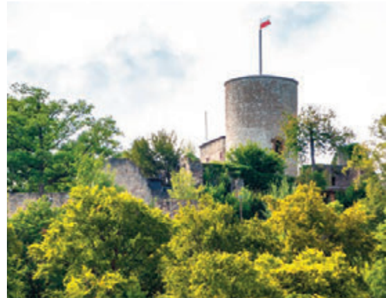
PASTORALREFERENTIN SONJA KOHR